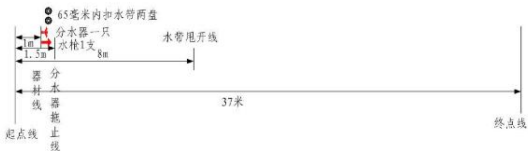
一人两盘65毫米水带连接操场地设置